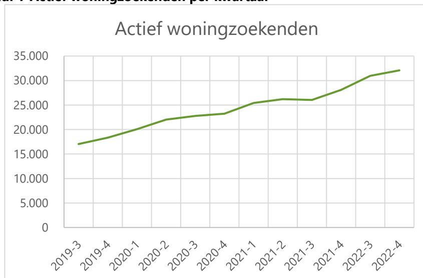
Figuur 7 Actief woningzoekenden per kwartaal