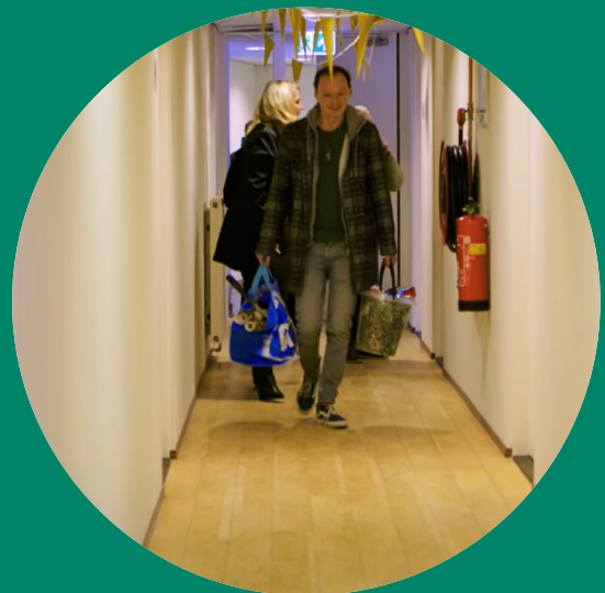
Sleutels nieuwe bewoners Jan Steenstraat.

WijCk Wonen Jan Steenstraat is het eerste gemengd wonen project in deze gemeente en onderdeel van Eerst een Thuis. WijCk Wonen is een samenwerking van Kwintes, GroenWest en de gemeente Woerden.