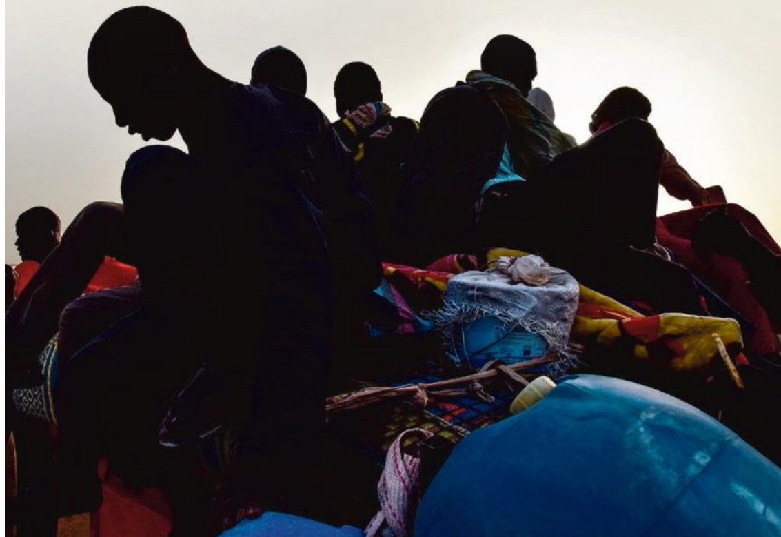
West-Afrikaanse migranten in Niger nadat ze Libië, de springplank naar Europa, vanwege geweld zijn ontvlucht.

Onder druk van de migratiecrisis haalde Brussel de banden de voorbije jaren toch weer aan. Zo stelde de EU in april vorig jaar 100 miljoen euro beschikbaar aan Soedan. Het geld wordt ingezet voor armoedebestrijding en het creëren van banen, maar ook voor betere grenscontroles en de bestrijding van mensensmokkel.